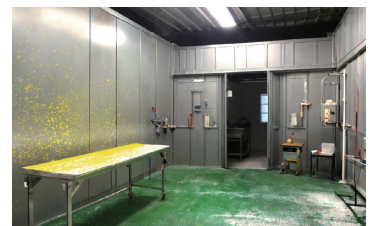
使用シーン：塗装ブースなど